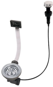
Vidange automatique 8407 100