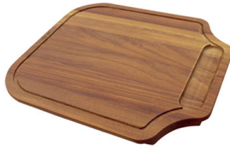
Planche de découpe en bois Iroko 8655 000